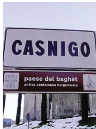
A Casnigo una giornata sulla cultura del baghèt

Ore 9,30-12,30, alla Ca' Parecia, via Foscolo, «Cibo è... Il giorno del raccolto» per riscoprire il piacere di una giornata nella natura raccogliendo le pannocchie di mai spinato; dalle ore 12,30, «Dal campo alla tavola» tipico pranzo bergamasco; ore 16,30-18, in piazza Vittorio Veneto, scartocciatura delle pannocchie, merenda, concerto degli «Aghi di Pino» e premiazione del concorso per le scuole secondarie «Cibo è... 140 caratteri e un clic» e per le scuole primarie «Cibo è... 140 caratteri e un disegno». Ore 18, sala consiliare, «Cibo è... Expo 2015 e le realtà locali» conferenza a cura dei Consiglieri regionali lombardi; dalle ore 20,30, al chiostro di S. Maria at Ruviales, via XX Settembre, «Cibo